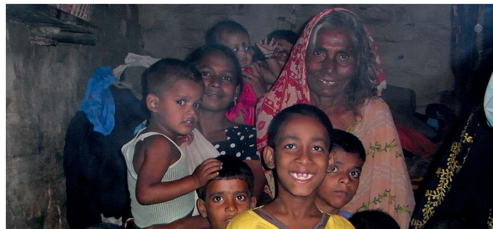
Freunde der Erziehungskunst Rudolf Steiners